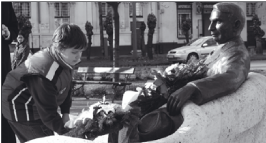
Móra Ferenc halálának 74. évfordulója tiszteletére megemlékezéseket rendeztek február 7-8-án város szerte. Részletek a 2. oldalon